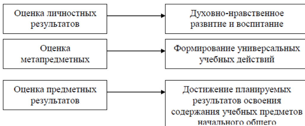
Рис. 1. Влияние системы оценки на образовательную деятельность

Система оценки как комплекс оценочных процедур мотивирует обучающихся на достижение планируемых результатов различных групп, но важным условием повышения уровня мотивации к образованию в течение всей жизни, освоению умения учиться является реализация программы формирования универсальных учебных действий, включающей типовую задачу «Технология безотметочного оценивания». Применение данной технологии позволяет сократить количество оценочных процедур, проводимых учителем на уроках, переориентировать систему оценки с «накопления отметок» на фиксацию достигнутых учащимися планируемых результатов, а также обеспечить формирование у учащихся универсальных учебных действий – контроля, оценки, познавательной рефлексии и смыслообразования.